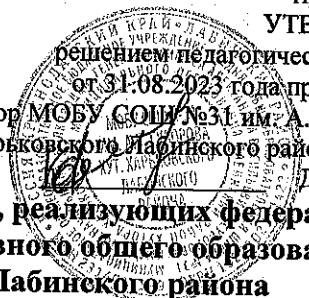
Таблица-сетка часов учебного плана для 7-9 классов, реализующих федеральный государственный образовательный стандарт основного общего образования МОБУ СОШ №31 города хут. Харьковского Лабинского района на 2023-2024 учебный год