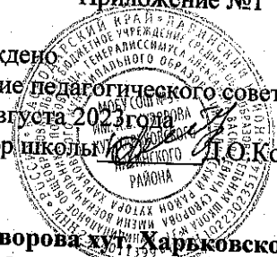
Таблица-сетка часов учебного плана для 5-6 классов МОБУ СОШ № 31 им. А.В.Суворова хутор Харьковского Лабинского района, реализующих ФГОС ООО-2021 в 2023 – 2024 учебном году